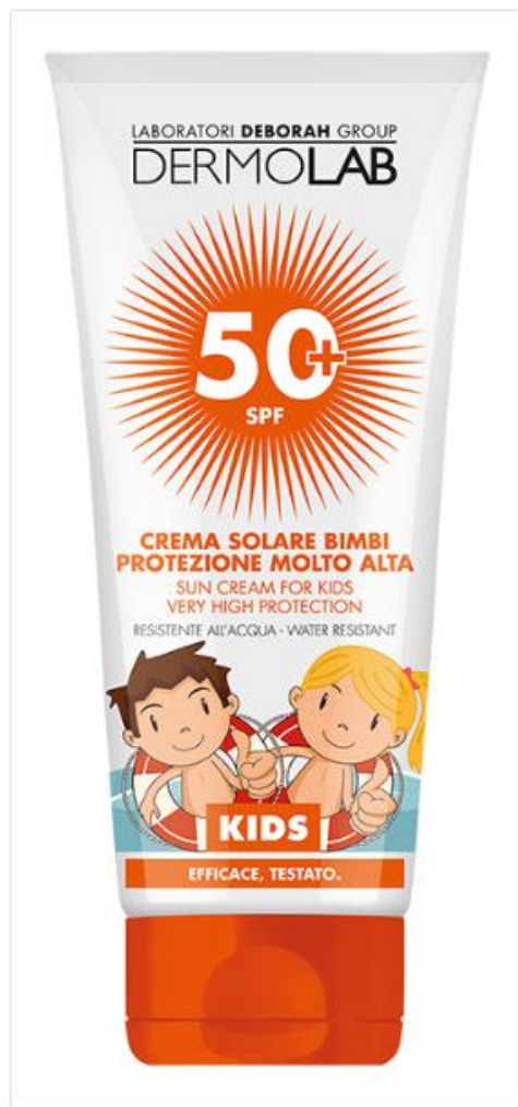
Dermolab, Solar Alta Protección Niños SPF 50+.