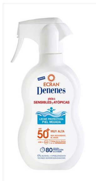
Ecran Denenes Leche Protectora 300ml SPF 50+ - pieles sensibles y atópicas.