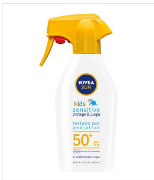
NIVEA SUN Sensitive Pistola Niños Protege & Juega