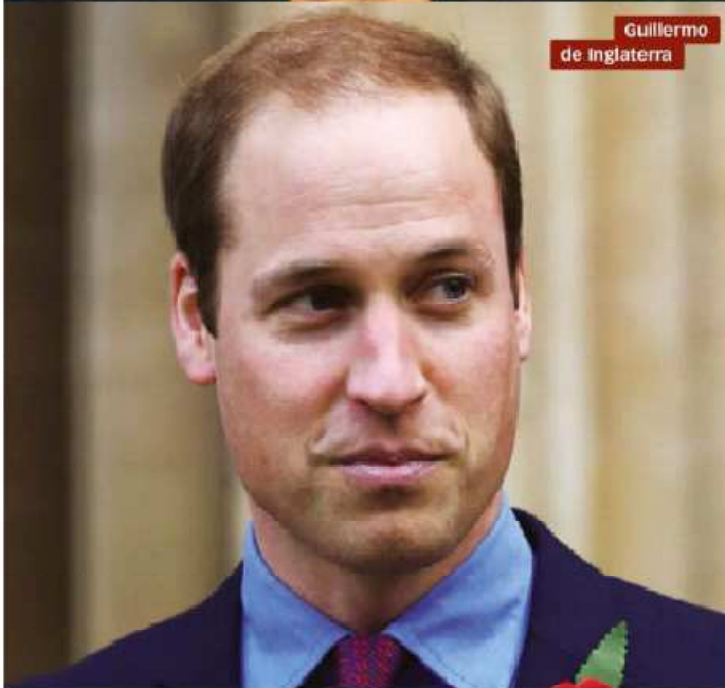
Guillermo de Inglaterra