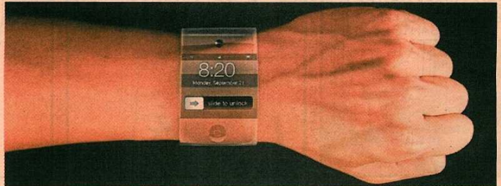
Una de las recreaciones que circulan por Internet sobre cómo podría ser el iWatch con pantalla curva.