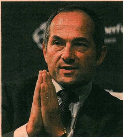
FREDERIC OUDÉA El CEO de Sociéte Générale es el primer cuarentón que aparece en el ranking de 'Business Insider'. El próximo julio cumplirá 43 años y está considerado uno de los más influyentes de Francia.

rejuvenecimiento entienden de edad atractivos. Una lista con hombre y mujeres y de todas las edades.