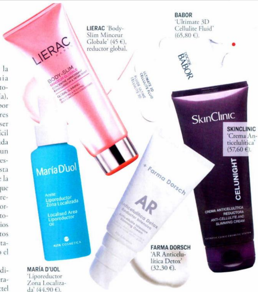
LIERAC 'Body-Slim Minceur Globale' (45 €), reductor global.

Según los datos de la AEDV (Academia Española de Dermatología y Venerología), entre el 80 y el 90 por ciento de las mujeres tenemos celulitis y, a pesar de ser un mal muy extendido y con difícil solución, cada primavera, la llegada de la operación destape provoca un boom de visitas a los centros de estética para intentar disimular esta poco favorecedora deformidad de la piel. Sus causas, que poco tienen que ver con el exceso de peso, están relacionadas con disfunciones del organismo, como problemas circulatorios, retención de líquidos o cambios hormonales, así como con hábitos de vida poco saludables: el sedentarismo, las dietas pobres en agua o el consumo de grasas, por ejemplo. Hasta ahora, las soluciones para difuminarla pasaban por la mesoterapia (microinyecciones con un cóctel