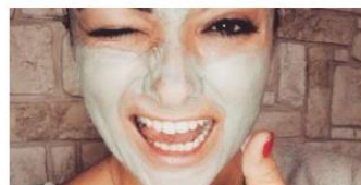
Sentirse guapa es cuestión de actitud