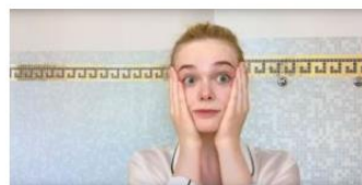
Así se maquilla Elle Fanning