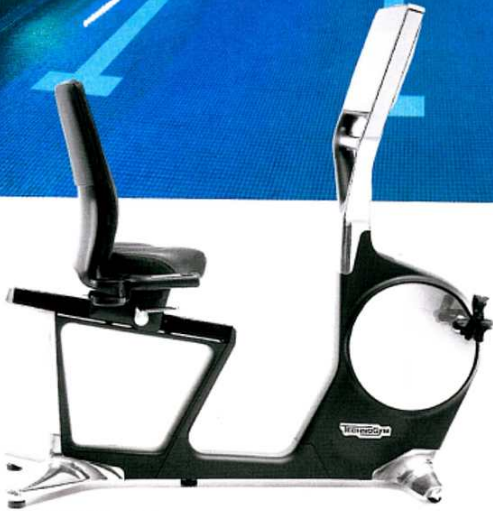
Los aparatos de entrenamiento corren a cargo de la Technogym, empresa puntera en la creación de equipaciones y dispositivos 'tecnológicamente inteligentes'.

3.500 m 2 en pleno centro de la capital, en la c/ Capitán Haya, en los que perderse y sentir el deporte de manera diferente. Bajo una filosofía desenfadada e inspiradora, este espacio desbordante de diseño y tecnología invita a quedarse allí para siempre entre cintas de correr que parecen saberlo todo del usuario, piscinas con luz natural e, incluso, un spa de aspecto casi virtual donde la absoluta relajación está asegurada. Además, los socios disponen de una zona lounge pensada para el relax después de una sesión de ejercicio, equipada con ordenadores de alta gama, prensa, televisión... Ideal para vivir un momento de tranquilidad (Tel. 917 705 891. www.virginactive.es ).