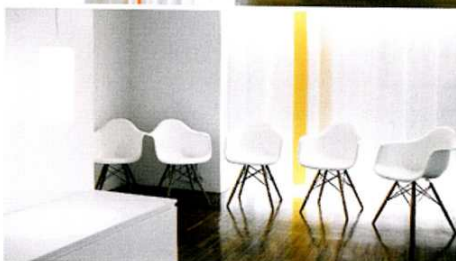
Espacios diseñados por el estudio de arquitectura Pieado con un estilo minimalista

Cálida, acogedora, con amplias salas en tonos blancos y un agradable olor a limpio. Así es la clínica del doctor Ruiz, cuyos avances tecnológicos no se quedan atrás, adentrándose, entre otros, en el universo de las aplicaciones para smartphones y tablets . Así, quien lo desee puede visualizar de antemano y con precisión, los efectos de los tratamientos antienvjecimiento más punteros sobre una foto gracias a un simulador antiaging , y salir de dudas de forma fácil y rápida. Las simulaciones disponibles se centran en los tratamientos de dermatología estética poco invasivos, como los realizados con toxina botulínica, ácido hialurónico, radiofrecuencia o láseres de última generación, visualizando con tan solo un clic, el resultado final de dichos tratamientos. Además, se puede regular la intensidad del efecto y compartir la foto a través de las redes sociales (Tel. 914 449 797. www.clinicadermatologicainternacional.com ).