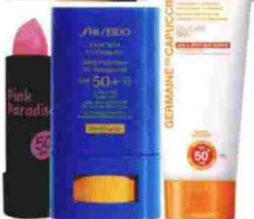
DE IZDA. A DCHA. CAMALEON PROTECTOR LABIAL COLOUR BALM PINK PARADISE SPF 50 (6,90 €). SHISEIDO PROTECTOR CLEAR STICK UV 50+ WET FORCE (32 €). GERMAINE DE CAPUCCINI EMULSION FLUIDA ALTA PROTECCION Y CONFORT SPF 50+ DELICATE SKIN (45,85 €).