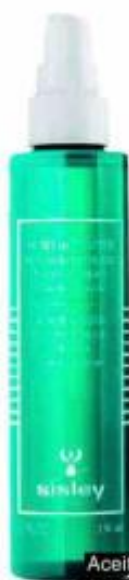
Aceite para piernas Huile Affinante pour les Jambes , Sisley (140 €).