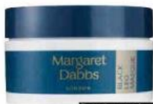
Para la pesadez de piernas Black Leg Masque Heavy Legs , Margaret Dabbs London (58,50 €).