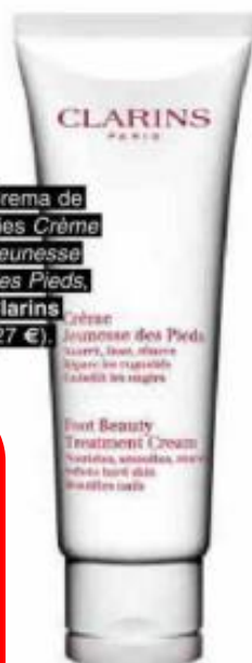
Crema de pies Crème Jeunesse des Pieds , Clarins (27 €).