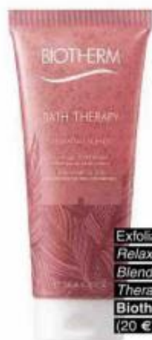
Exfoliante Relaxing Blend Bath Therapy , Biotherm (20 €).

Centros de belleza y spas ofrecen tratamientos específicos para aliviar sobrecargas, tensiones o hinchazón. Heel Massage , por ejemplo, reduce el cansancio en la planta de los pies y la presión en el tobillo, lo realizan en el spa Royal Hideaway Sancti Petri (precio: 95 €). ¿Tienes un evento especial? Carmen Navarro apuesta por el método drenante Bioslimming T-Shock dos o tres días antes: favorece el retorno linfático y activa las zonas donde se acumula la grasa (precio: 82 €). Y, si es necesario remodelar, descongestionar y reafirmar los tobillos, el protocolo Led me up! de Le Petit Salon es perfecto: aúna la tecnología LED drenante con masaje manual reductor (precio: 55 €).